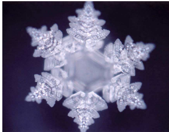
Cristallo che si sta deformando: pensiero negativo

Ricorderò alcuni passaggi sia delle dinamiche d'attrazione, sia del pensiero.